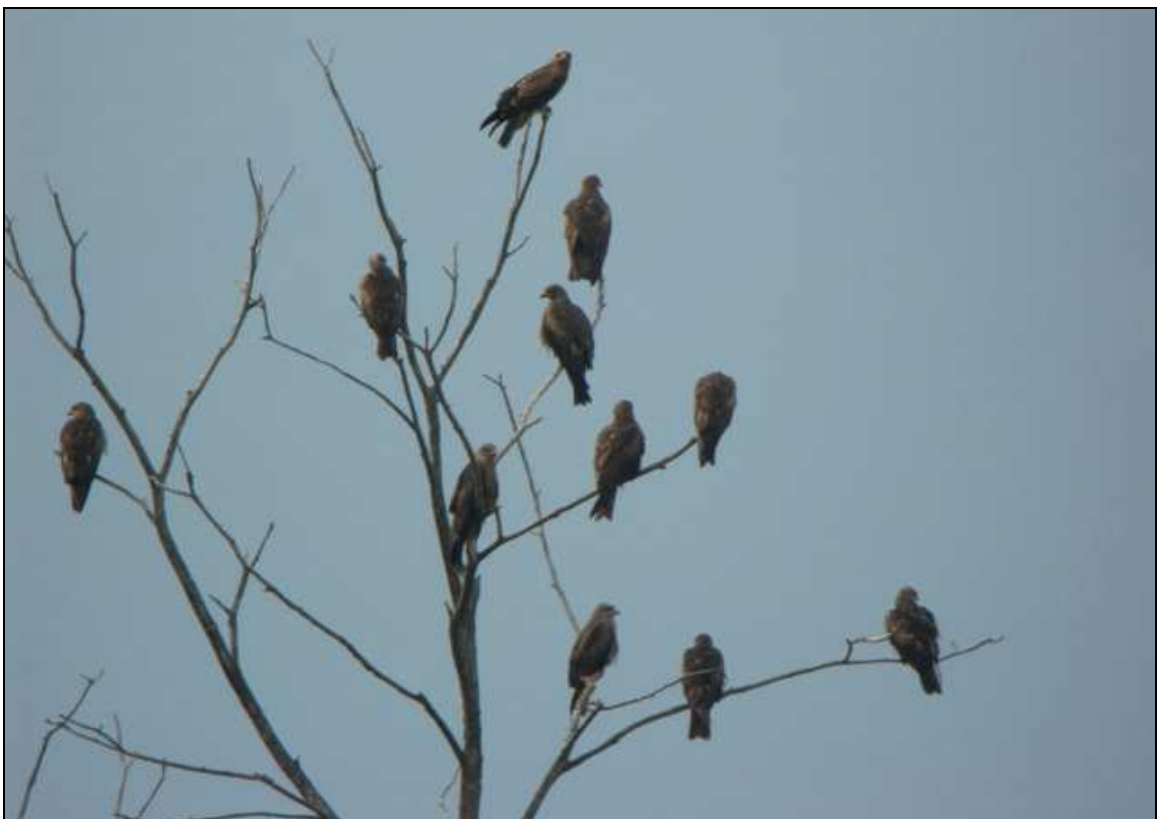
22.07.2010 - Nibbio bruno – La Mandria