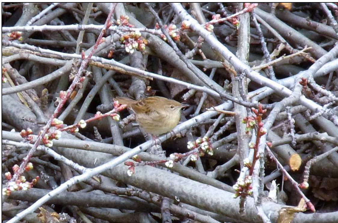
08.05 Forapaglie macchiettato – Bardonecchia

1 ind il 08.05 a Bardonecchia (TAC), 1 nel territorio politico francese nei pressi del colle del Moncenisio il 15.08 (DDN), 1 a Rivalta il 31.08 (ASG) 1 presso il lago Rosset a Ceresole Reale il 04.09 (DDN) a 2000 mt slm;