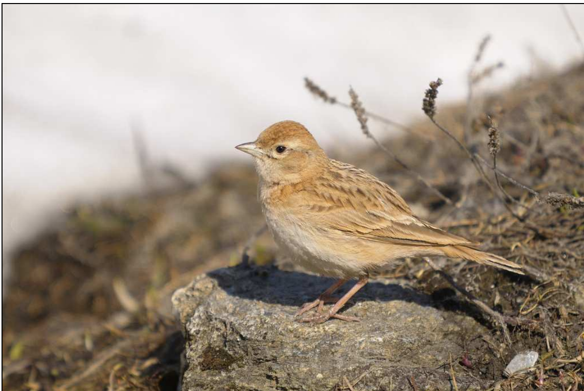
24.05.2010 - Calandrella – Moncenisio