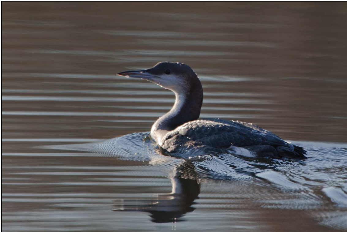
12.12.2010 - Strolaga mezzana – Lago di Bertignano