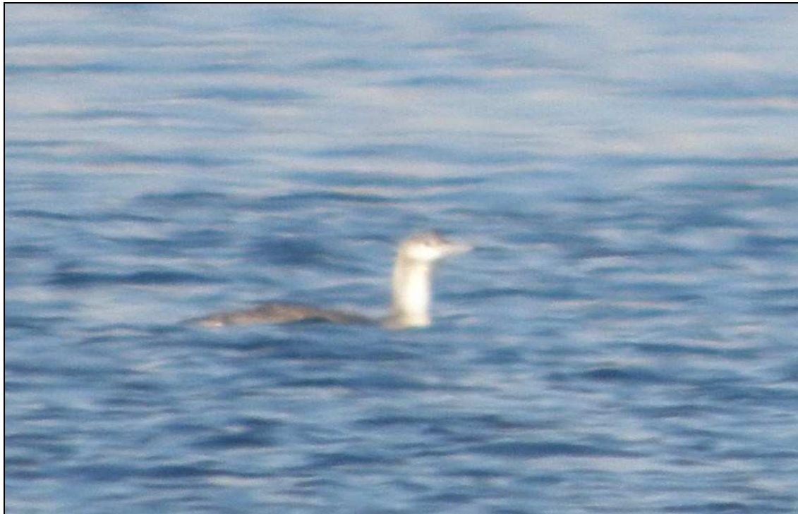
14.12.2010 - Strolaga minore – Lago di Viverone