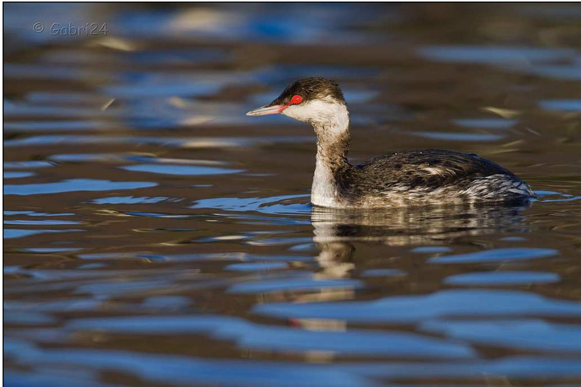
Svasso cornuto – Lago di Viverone