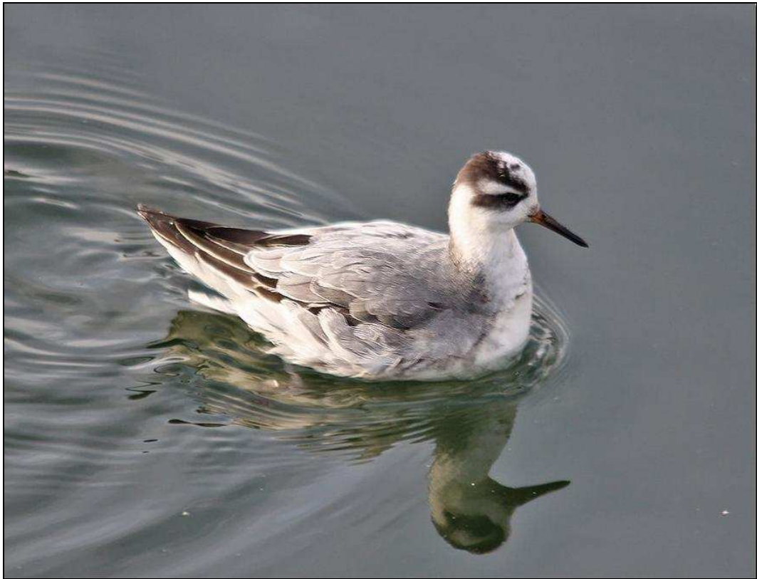
22.11.2010 - Falaropo beccolargo – Lago Grande di Avigliana