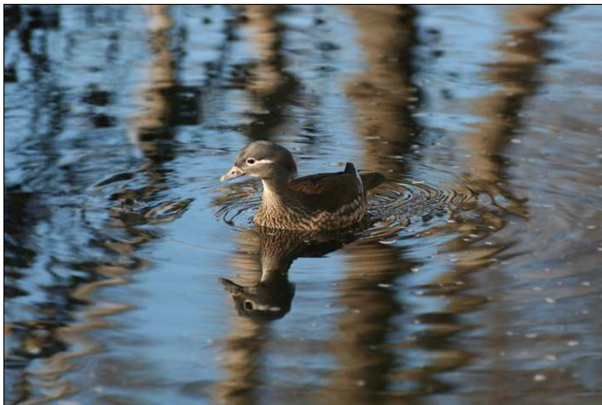
11.12.2010 - Anatra mandarina - Viverone

2 ind. sul fiume Po nel tratto urbano il 05.01 (CAD). Varie osservazioni nel mese di gennaio e febbraio presso la Diga del Pascolo a Torino con un max di 3 ind. (Oss. Vari). 1 ind sul Po il 09.04 a Gassino (MAP) e il 02.10 a Monteu da Po (MAP)