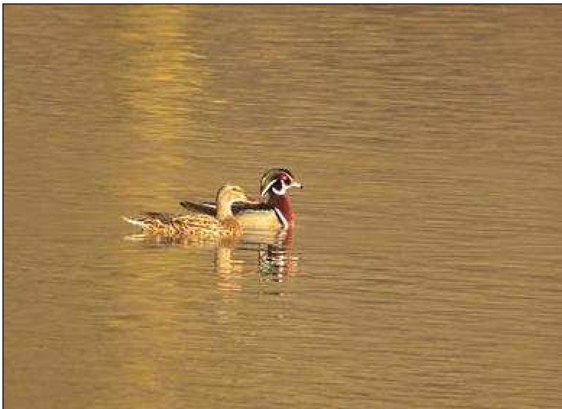
12.12.2010 Anatra sposa – Lago di Arignano

1 maschio di origine afuluga osservato sul lago di Arignano il 12.12 (PIL)