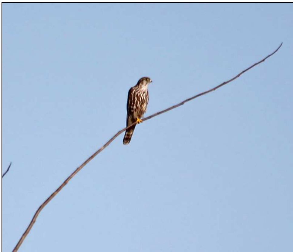
06.01.2010 - Smeriglio – Montanaro

Ultima segnalazione il 05.03 sul fiume Po a Cavagnolo (DDN), prima segnalazione invernale il 20.10 a Cambiano (PIL)