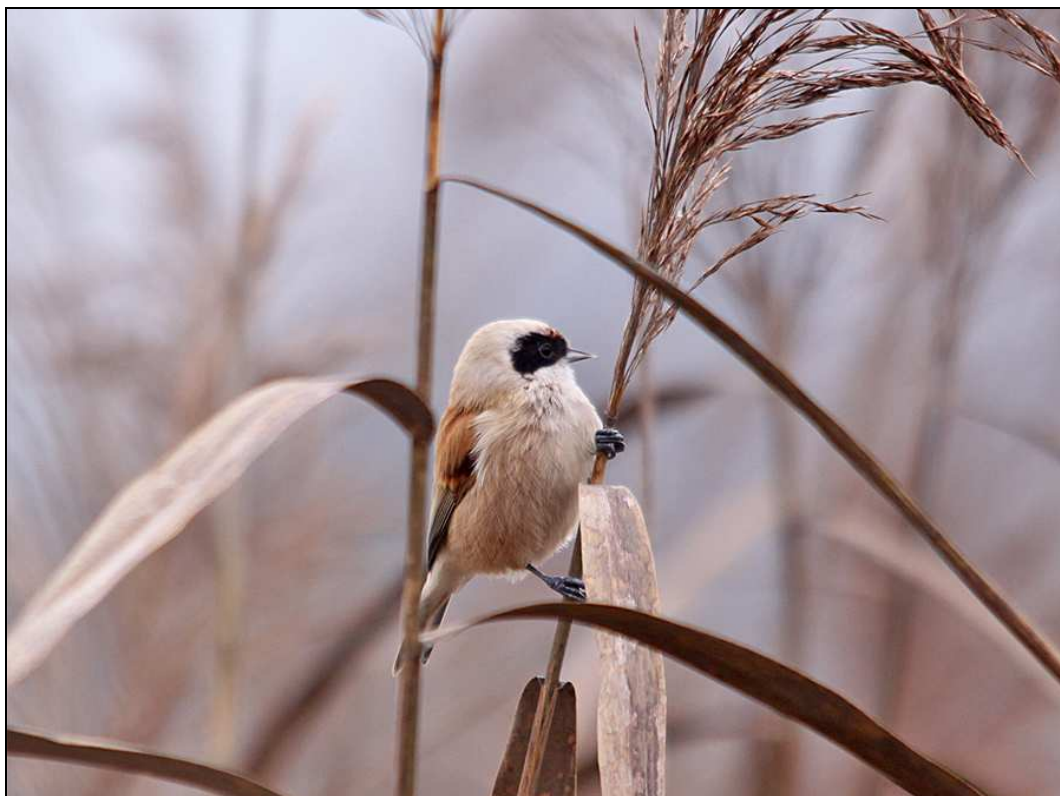
13.11.2010 - Pendolino – Candia