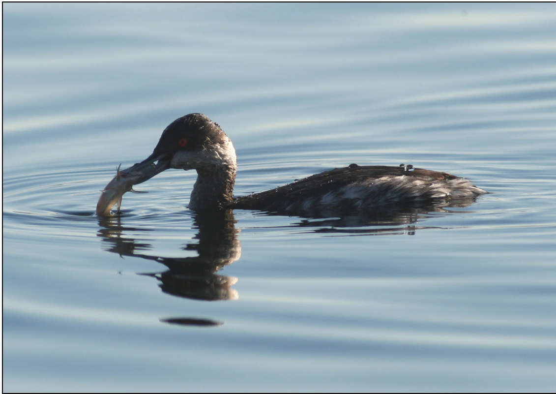
11.12.2010 - Svasso piccolo - Lago di Viverone