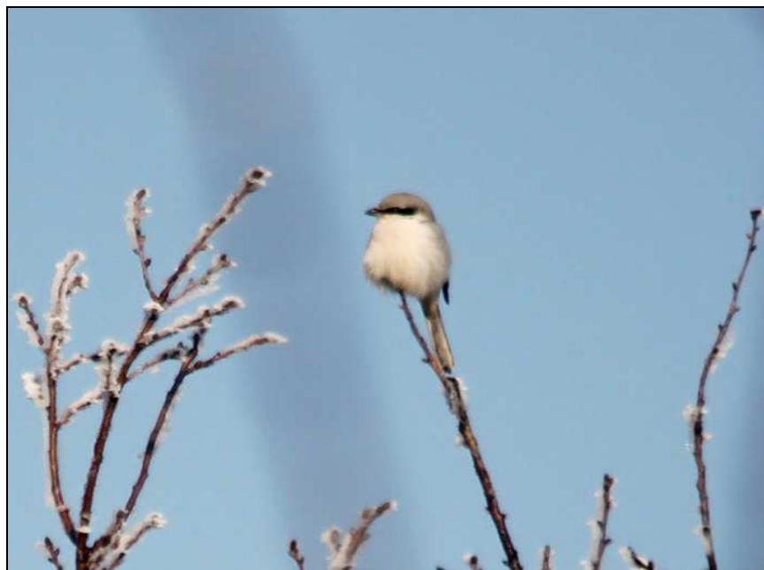
09.01.2010 - Averla maggiore – Settimo

Date estreme : 1 ind alla Mandria il 29.03 (PAP), 1 ind il 09.10 a Settimo (DDN).Pervenute 30 segnalazioni relative ad almeno 17 individui.