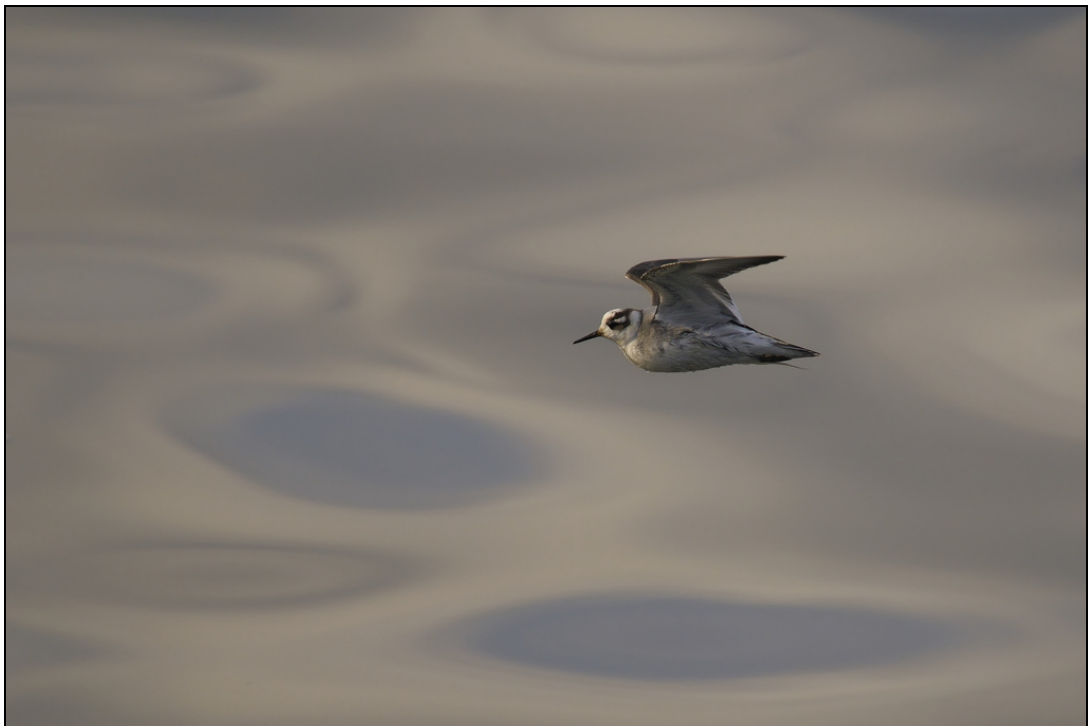
22.11.2010 - Falaropo beccolargo – Lago Grande di Avigliana