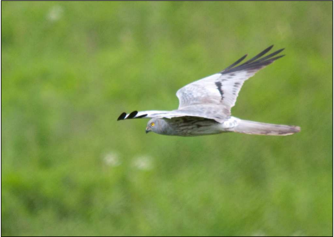
09.05.2010 - Albanella minore – Montanaro