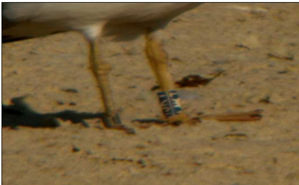
03.08.2010 – Lettura di anello di Gabbiano reale – La Mandria

14 ind sul colle della Crocetta a a 2160 mt slm a Ceresole Reale il 19.07 (TOP). Stimati circa 4000 ind in spostamento dalla discarica Cassagna a Pianezza il 16.10 (ALG et altri)