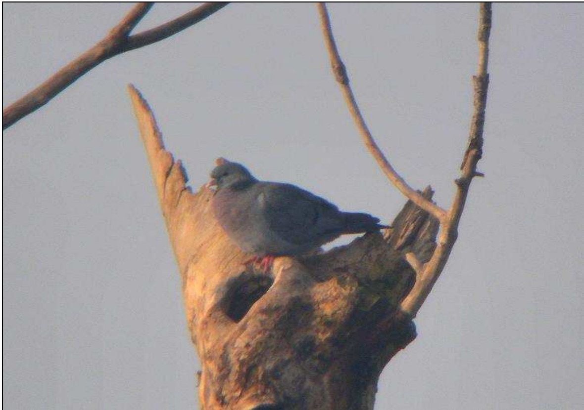
30.01.2010 – Colombella – San Sebastiano da Po

Nidificazione all'interno del Parco della Mandria osservata il 09.05 (PAP). Altre segnalazioni a Cavagnolo il 05.03 (DDN) e a San Sebastiano il 31.07 (MAP)