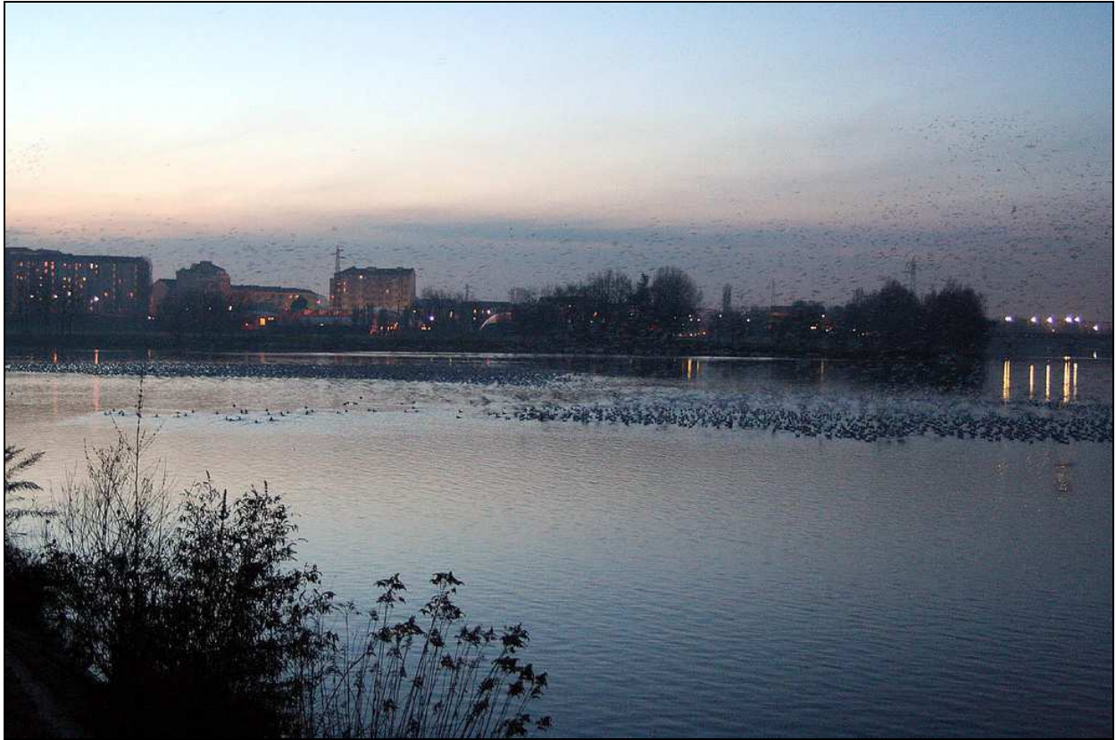
12.02.2010 - Gabbiano comune pre- roost - Diga del Pascolo –Torino