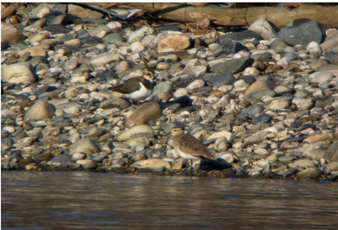
04.12.2010 - Pavoncella gregaria - Monteu da Po