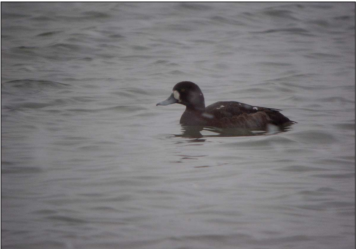
07.03.2010 - Moretta grigia - Diga del Pascolo