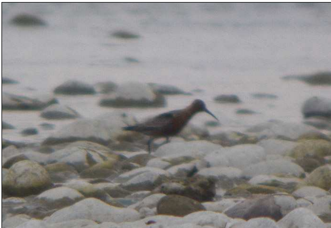
10.07.2010 - Piovanello comune Monteu da Po