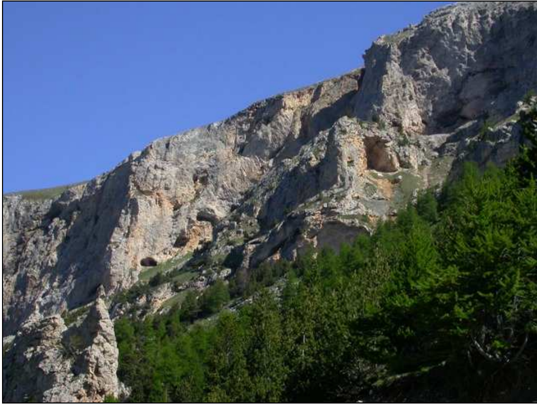
17.07.2010 Sito nidificazione Taccola a 2200 mt – Pramand