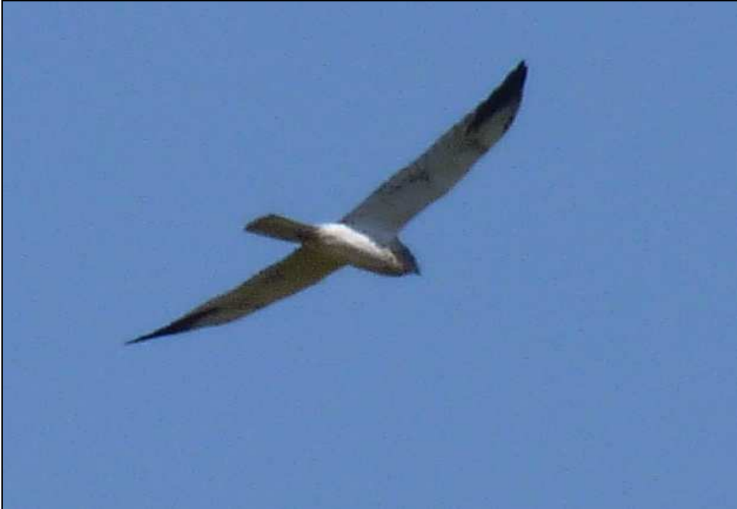
15.09.2010 - Albanella pallida – Montanaro

Un maschio osservato il 15.09 a Montanaro (ASG), si tratta della quarta osservazione della specie in provincia.