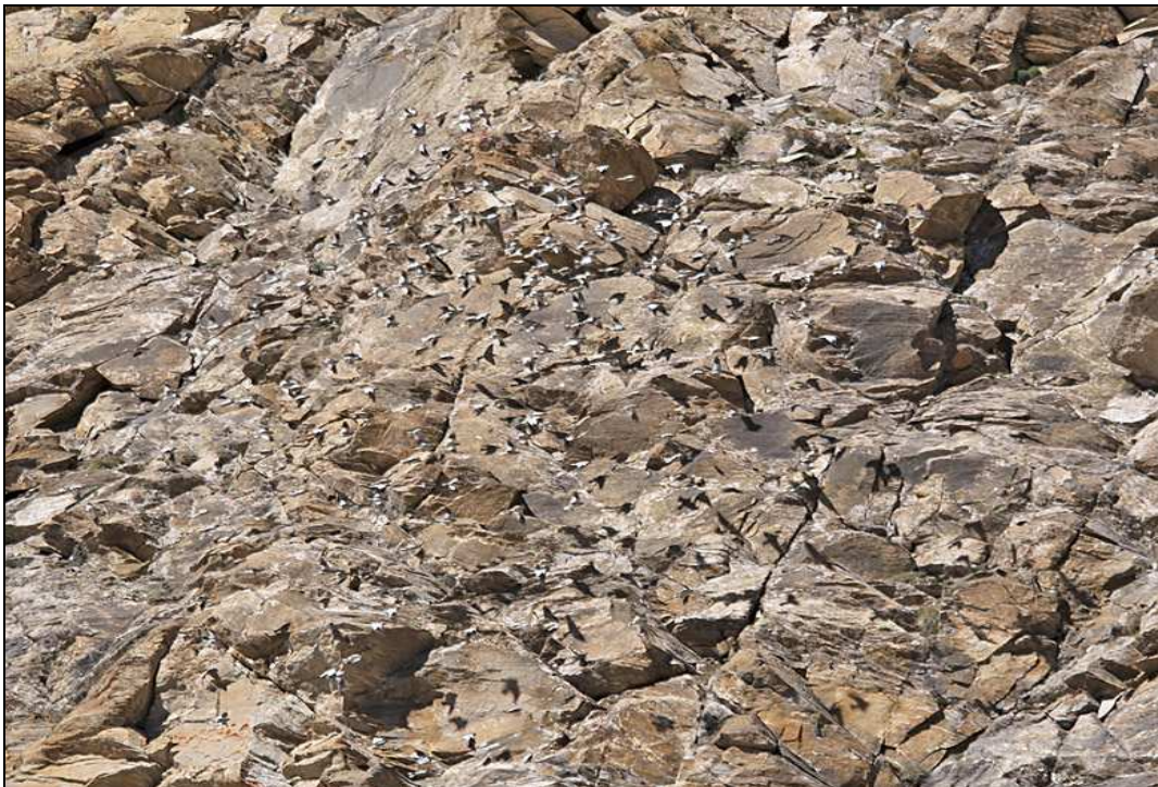
26.08.2010 - Raggruppamento notevole di Fringuelli alpini - Laghi Rosset