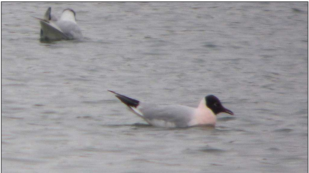
07.03.2010 - Gabbiano comune con piumaggio rosa - Diga del Pascolo –Torino