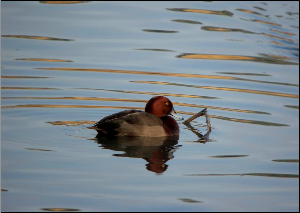
10.01.2010 - Ibrido di Aythya - Diga del Pascolo