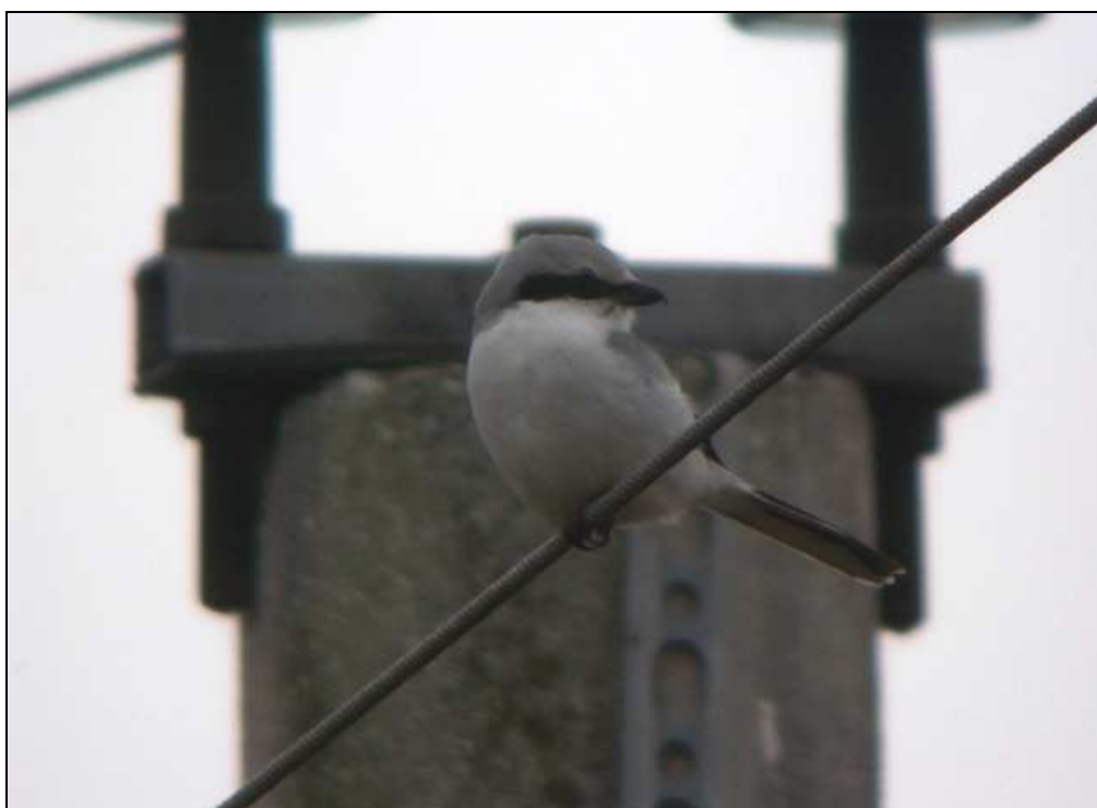
06.11.2010 - Averla maggiore – Candia