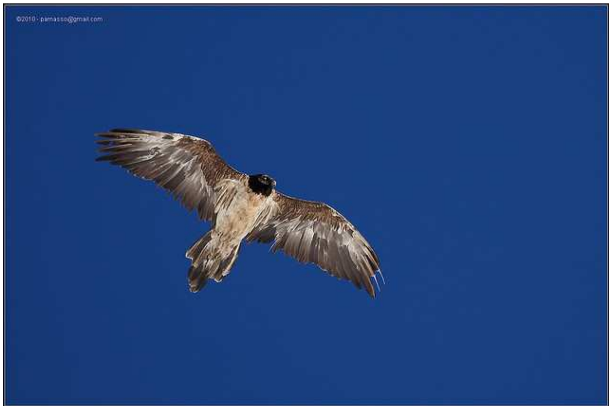
20.02.2010 - Gipeto – Colle del Nivolet