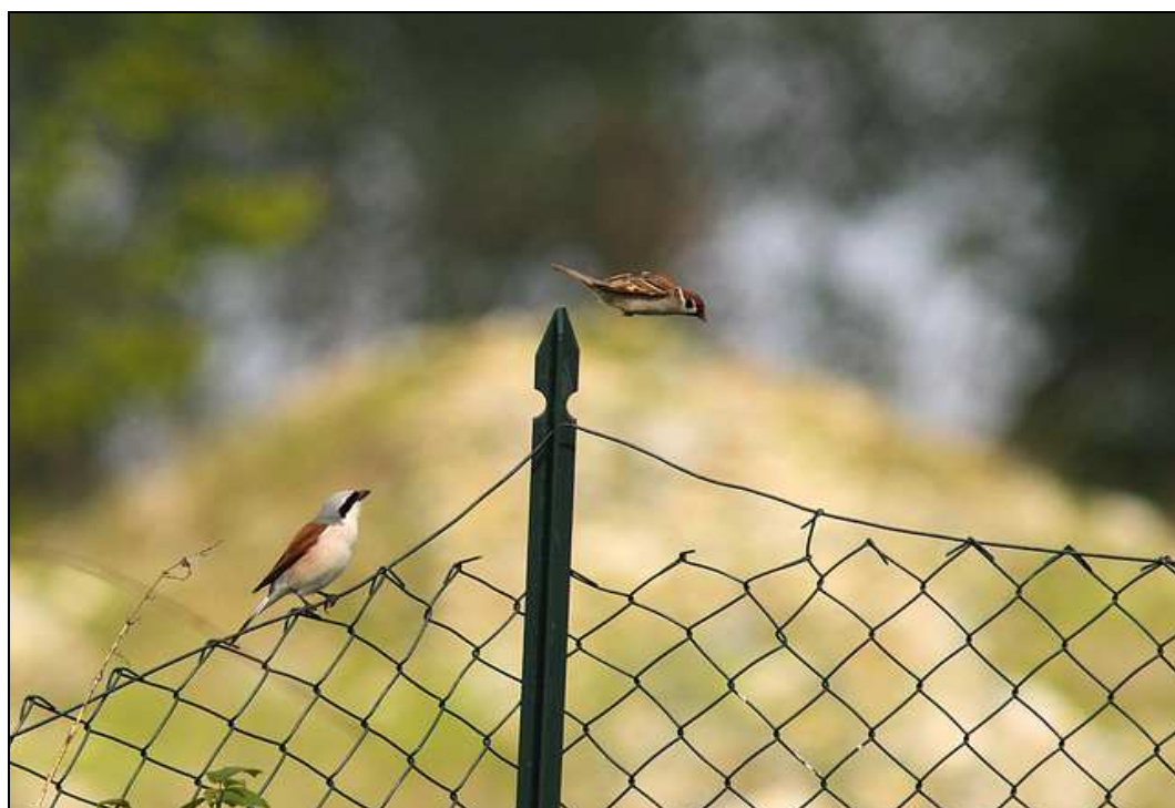
08.05.2010 - Averla piccola e e Passera mattugia – Montanaro