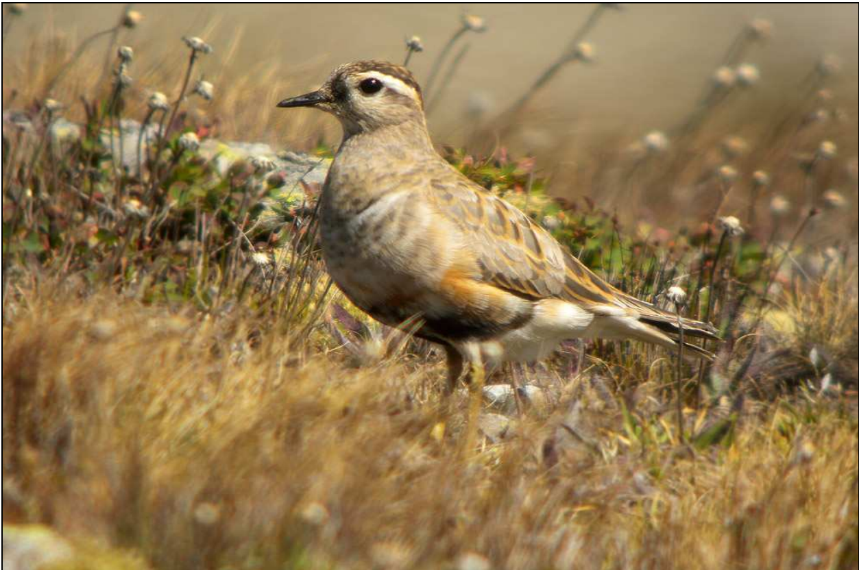
29.08.2010 - Piviere tortolino - Alta Valle Susa