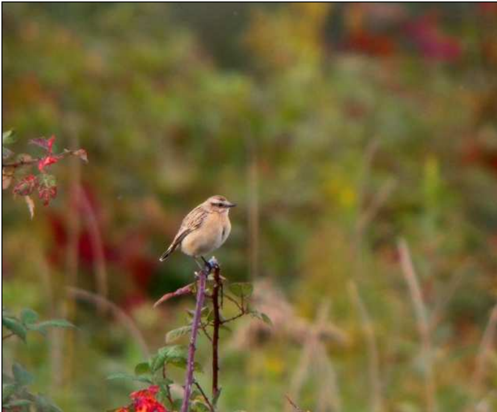
05.10.2010 Stiaccino - Montanaro