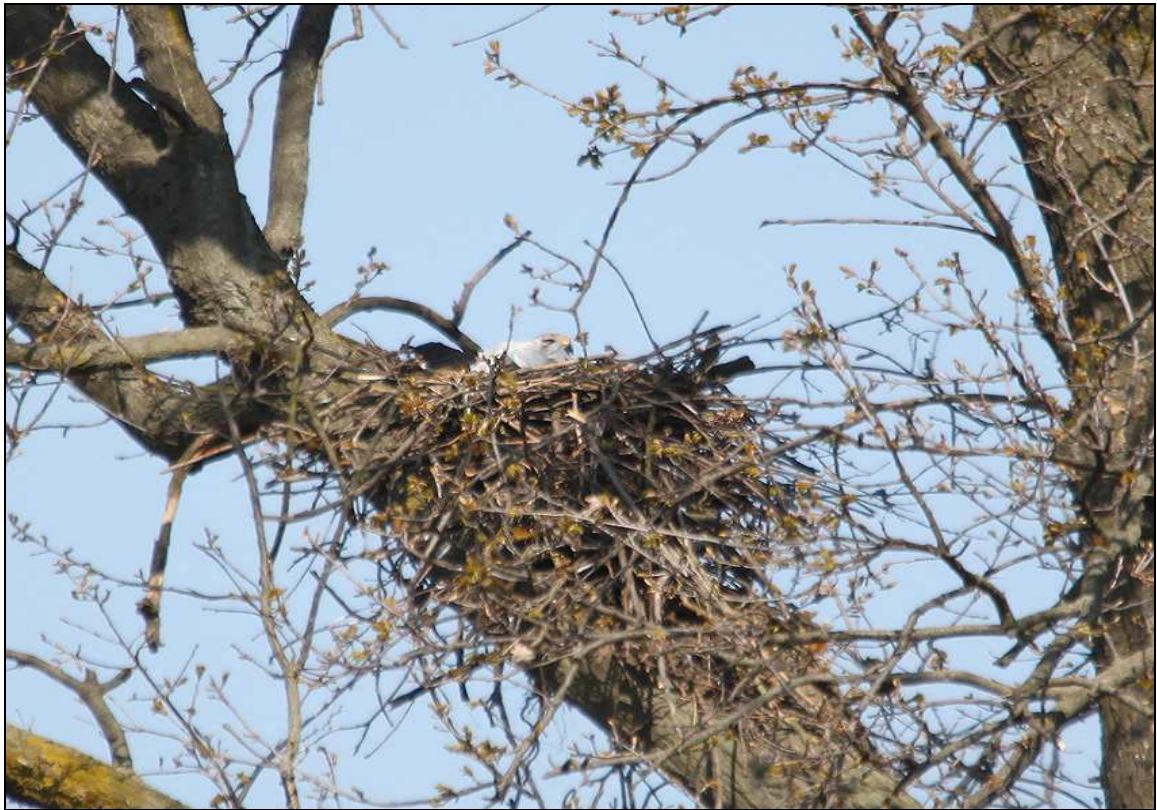
14.04.2010 - Nibbio bruno – Montanaro