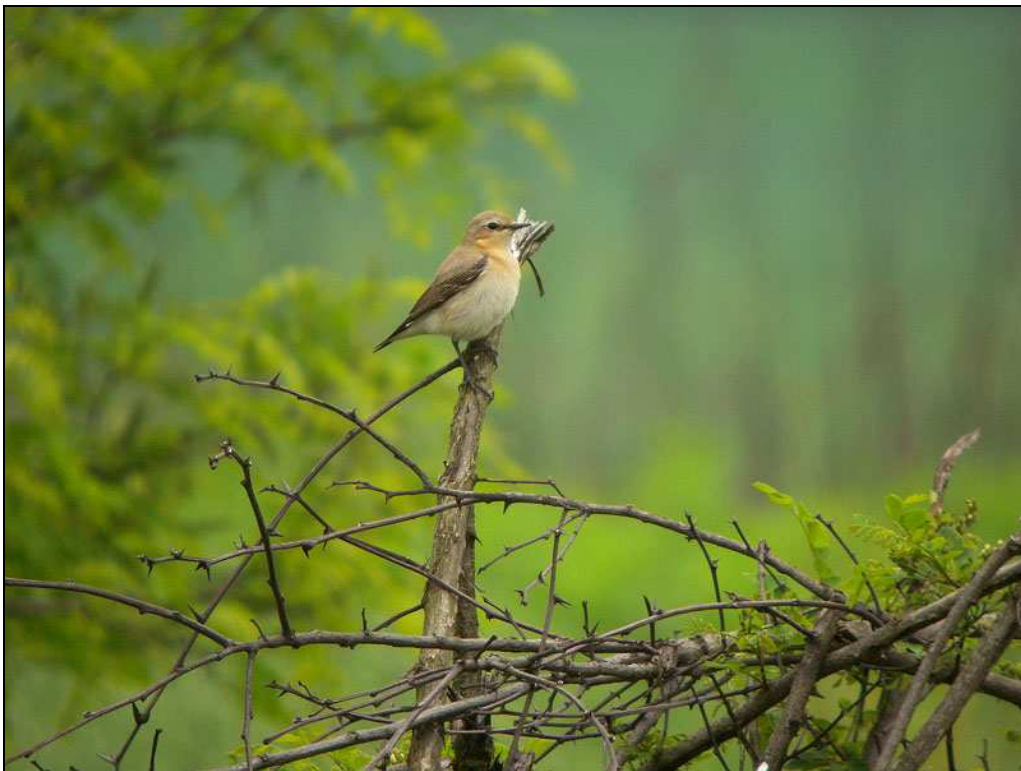
08.05.2010 Culbianco - Montanaro