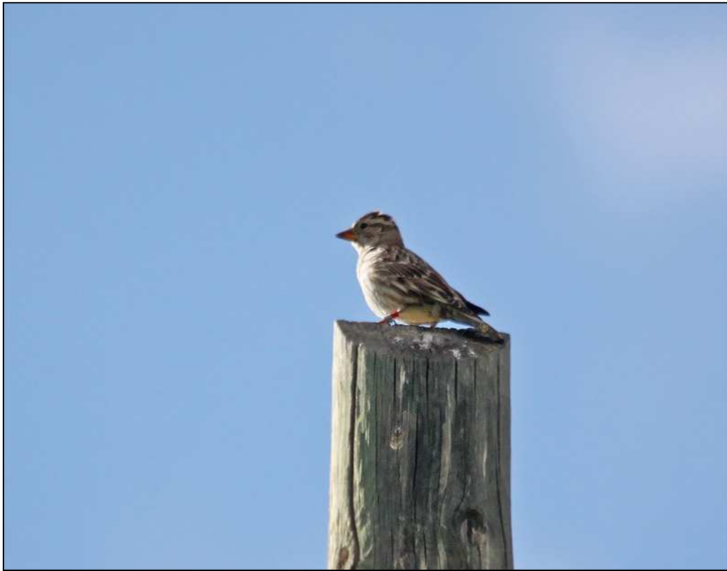
02.06.2010 - Passera lagia – Champlas