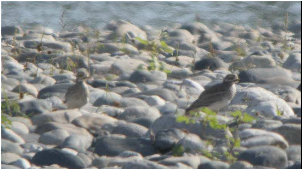
11.09.2010 - Occhioni - Monteu da Po