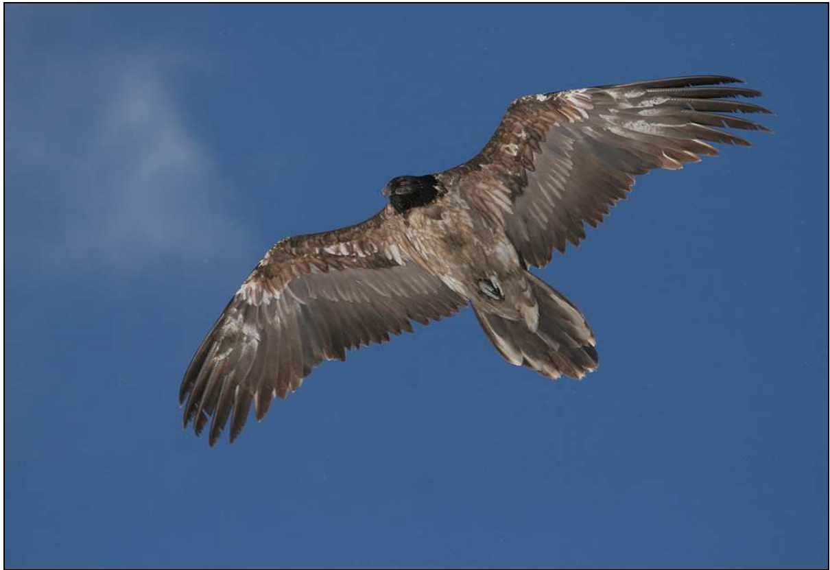
28.09.2010 - Gipeto – Colle dele Finestre