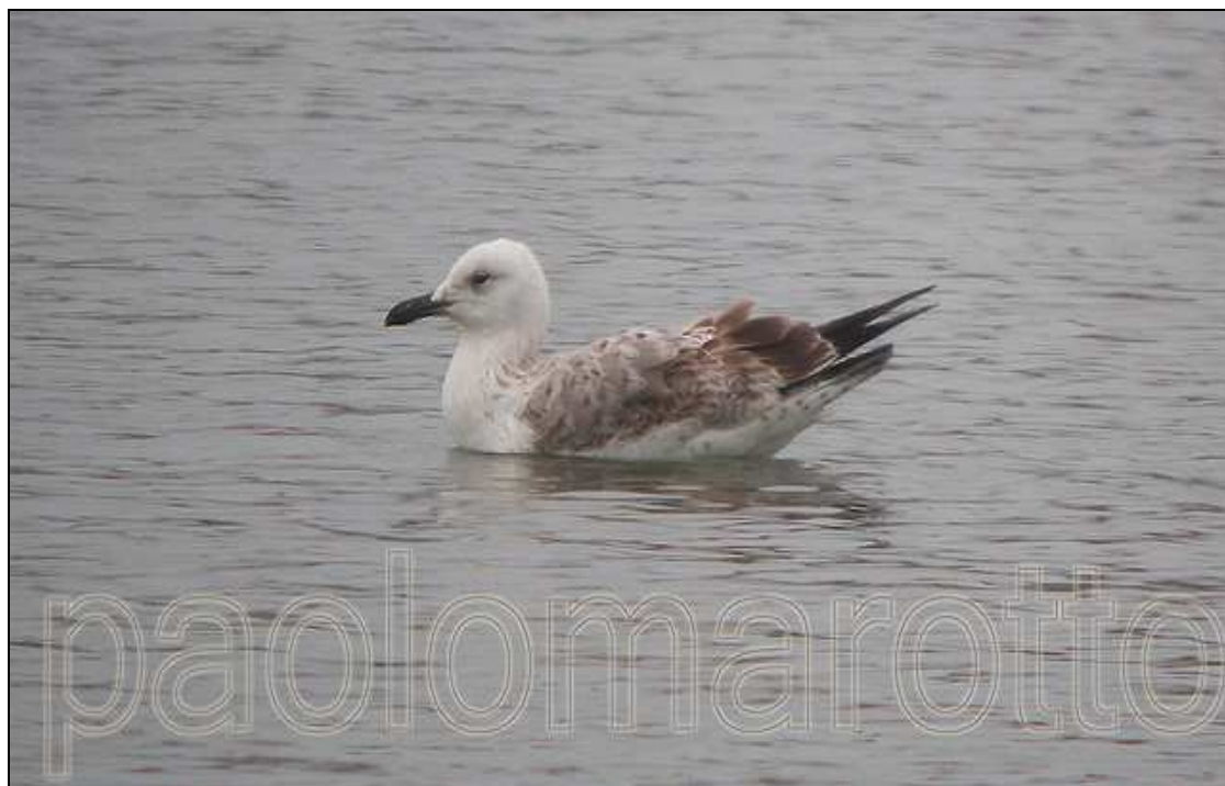
07.03.2010 - Gabbiano pontico – Diga del Pascolo –Torino

4 segnalazioni di cui però solo una con documentazione fotografica : 07.03 1 ind alla diga del Pascolo a Torino (MAP, DDN). Le altre osservazioni in attesa di omologazione: 1 il 16.02 e 1 il 06.03 sempre alla diga del Pascolo (DDN), 2 ind il 01.12 presso Druento (DDN)