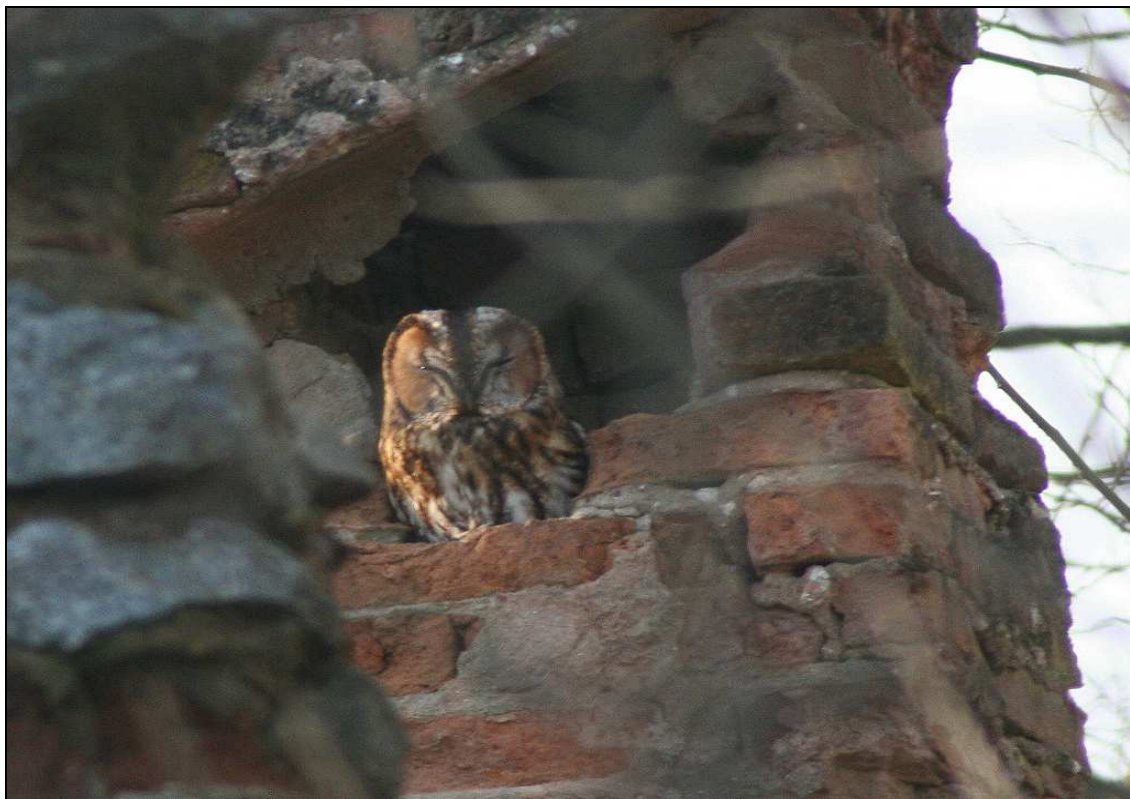
Gennaio 2010 - Allocco – Azeglio

Segnalazioni di ind in canto all'interno del Parco della Mandria di origine incerta (aufughi) (PAP).