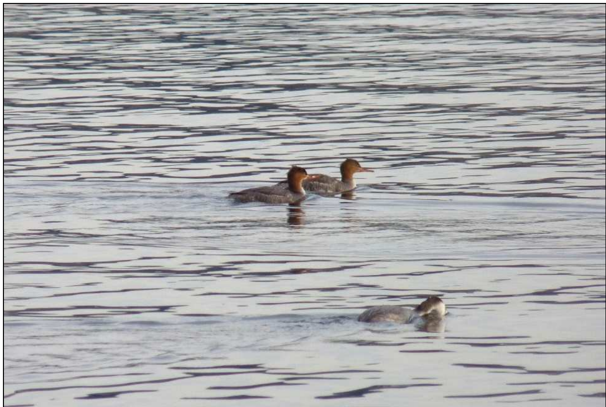
03.12.2010 - Smergo minore - Lago di Viverone