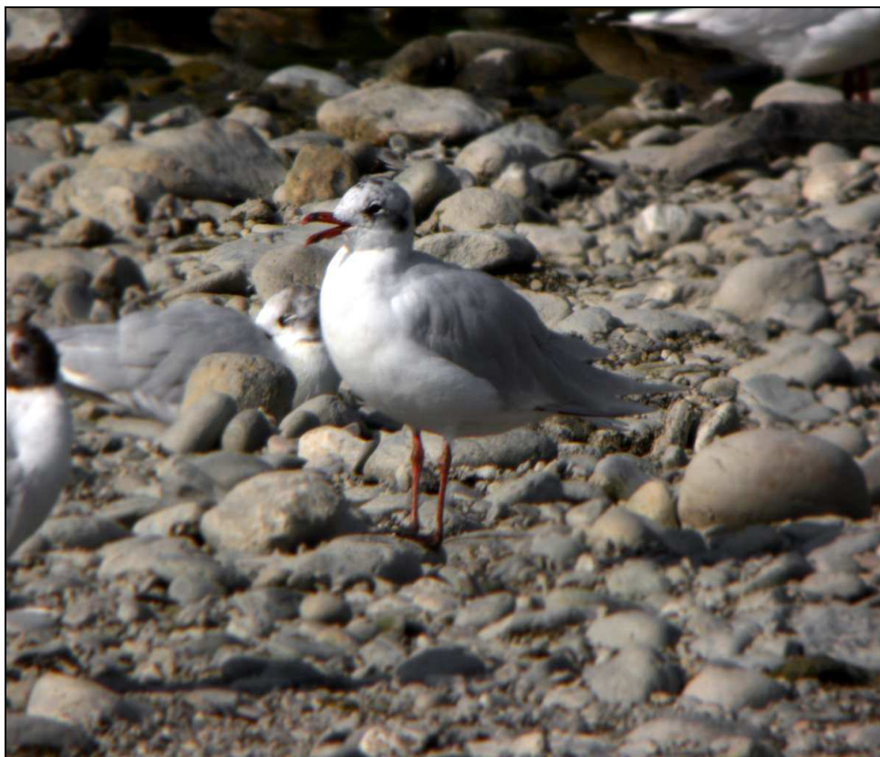
01.08.2010 – Gabbiano corallino – Diga del Pascolo - Torino

Presenze di singoli individui nei mesi invernali (oss.vari) Una osservazione estiva il 07.07 a Savonera (BOA)