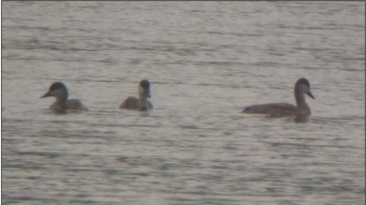
14.10.2010 - Fistione turco - Diga del Pascolo