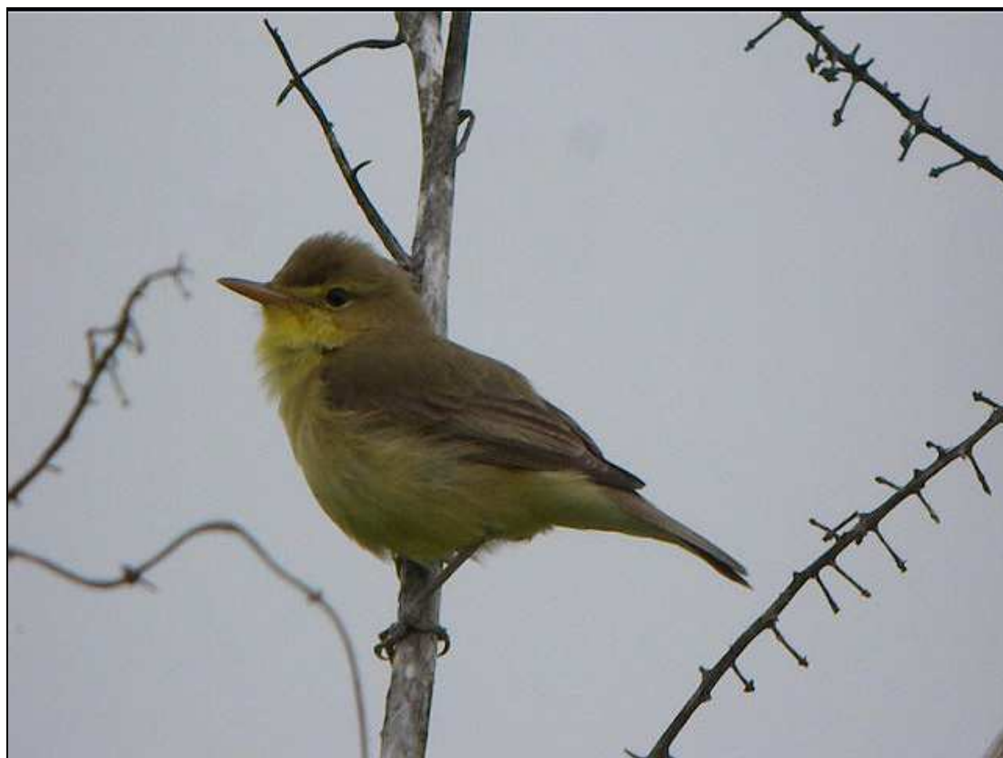
08.05 Canapino comune – Montanaro

Date estreme il 25.04 alla Mandria (PAP) e 17.09 a Settimo (DRA)