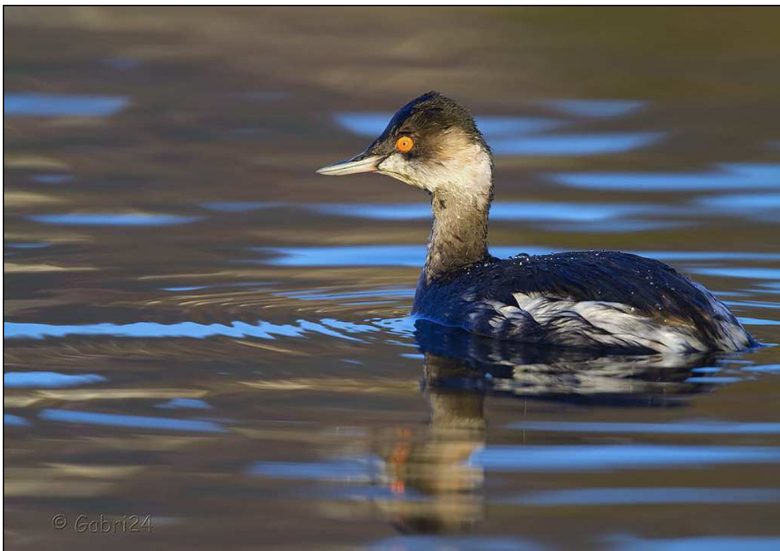
Svasso piccolo – Lago di Viverone