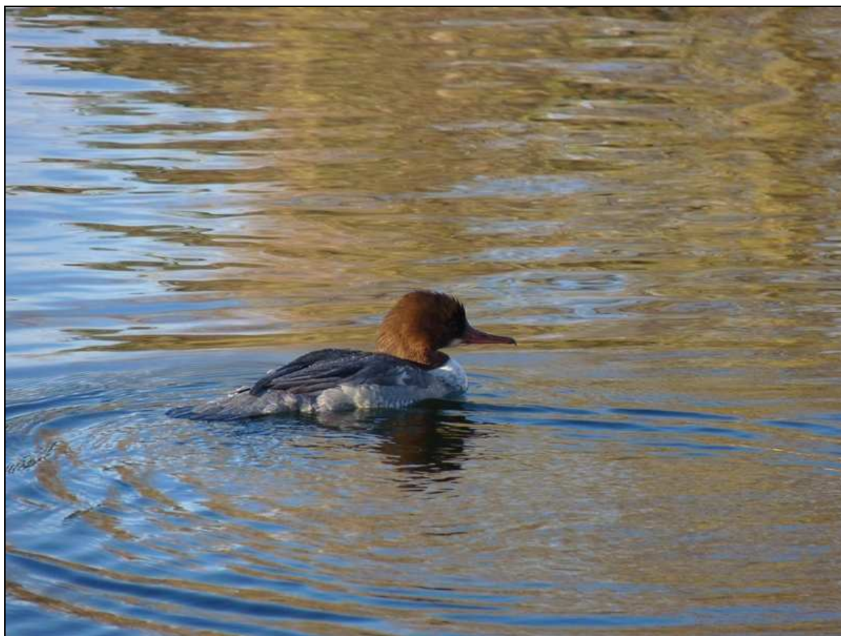
03.12.2010 - Smergo maggiore - Lago di Viverone

Sul lago di Viverone 1 ind dal 02.01 (MAG). 1 ind dal 01.12 al 30.12 (Oss. Vari). Sul lago di Avigliana 1 ind il 08.12 (ASG). 1 ind il 13.12 a Candia (DDN), 1 il 08.01 nel tratto urbano del Po (CAD) e 1 il 26.02 presso la Diga del Pascolo (DDN)