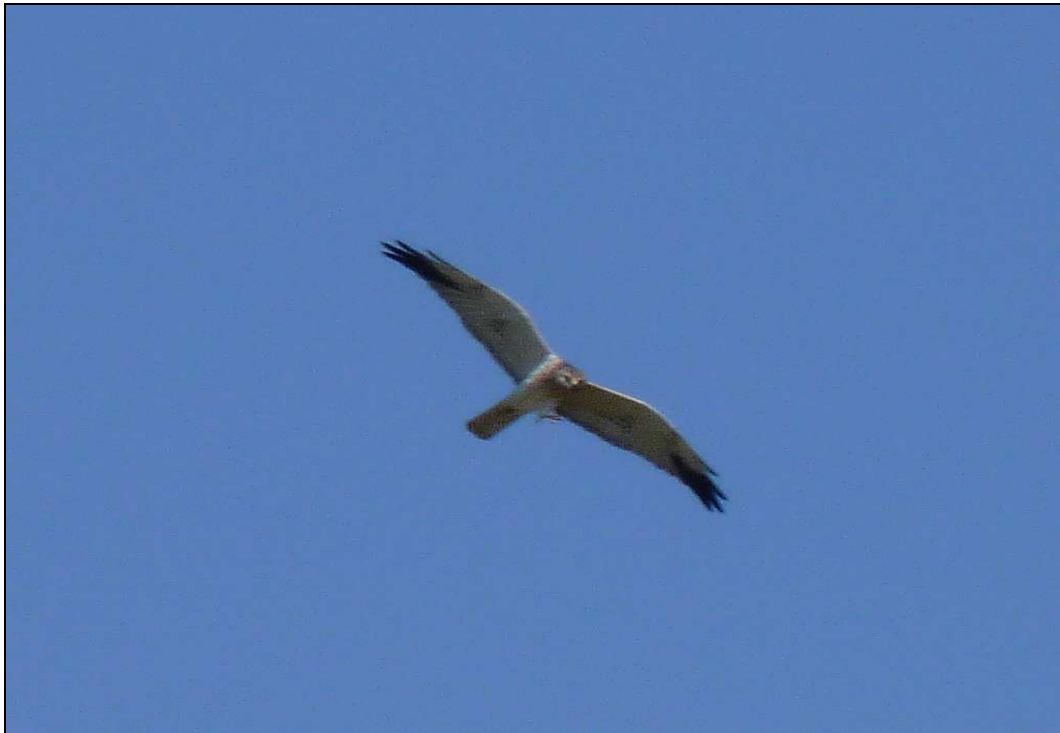
15.09.2010 - Albanella pallida – Montanaro