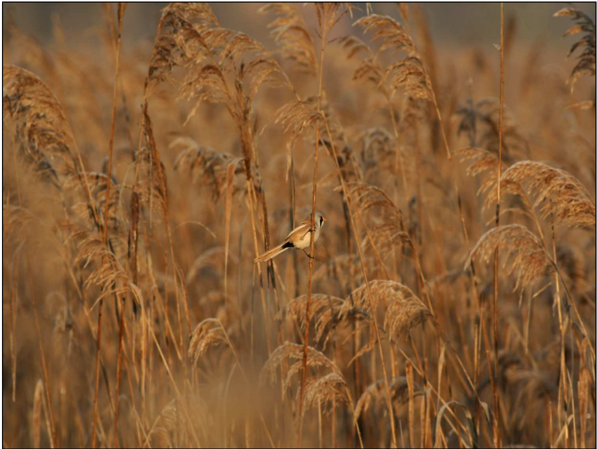
Dicembre 2010 - Bassettino – Palude di Candia