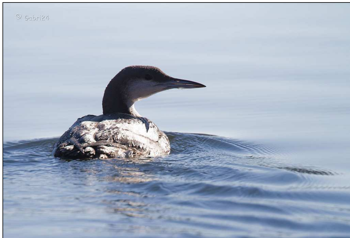
Strolaga mezzana – Lago di Viverone