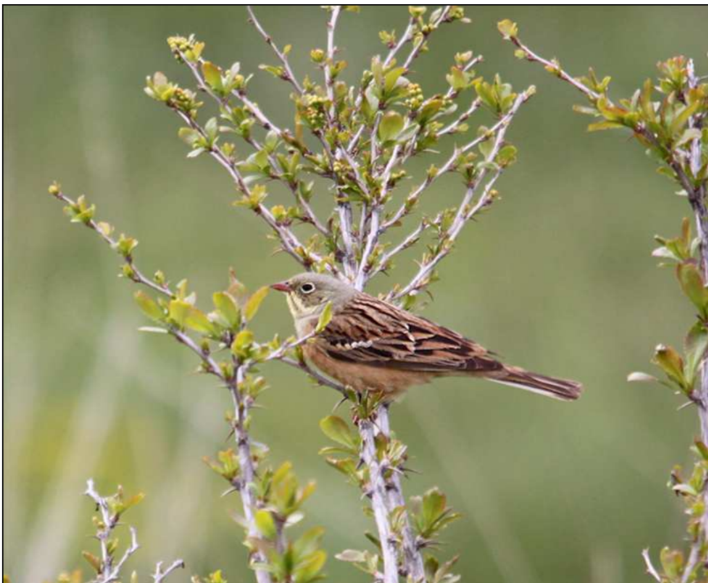
02.06.2010 - Ortolano – Champlas

Massime concentrazioni: 47 ind in migrazione presso cascina Bremont a Rivoli (ASG) il 18.10, più di 50 ind il 30.10 a Caselette (FEG), circa 60 ind il 05.12 alla Mandria (PAP)