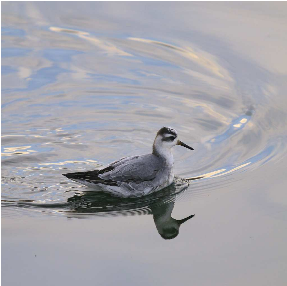
22.11.2010 - Falaropo beccolargo – Lago Grande di Avigliana