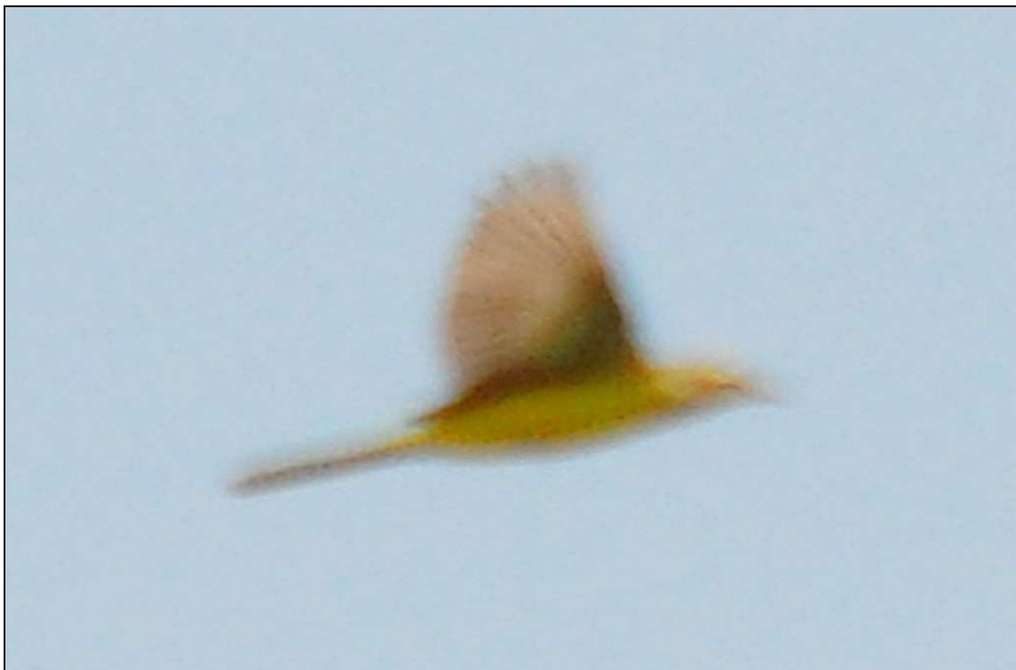
25.04.2010 - Cutrettola "flavissima" – Montanaro