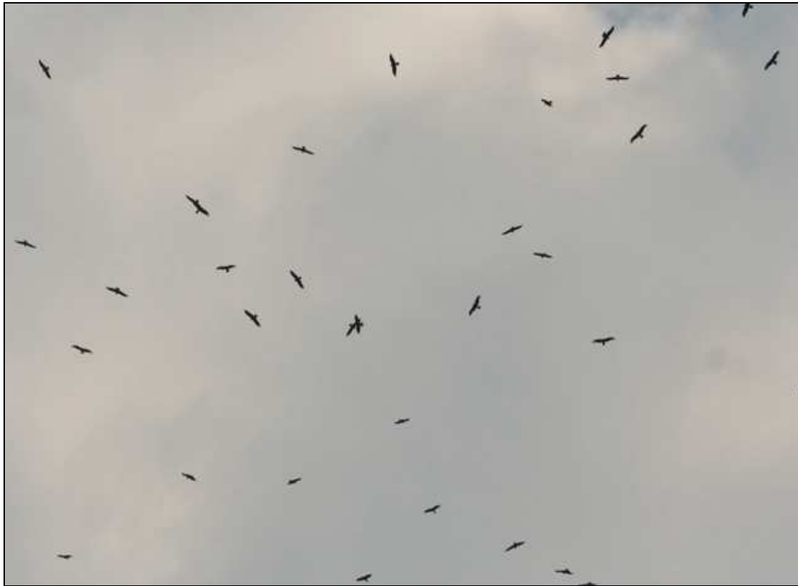
22.07.2010 - Nibbio bruno – La Mandria