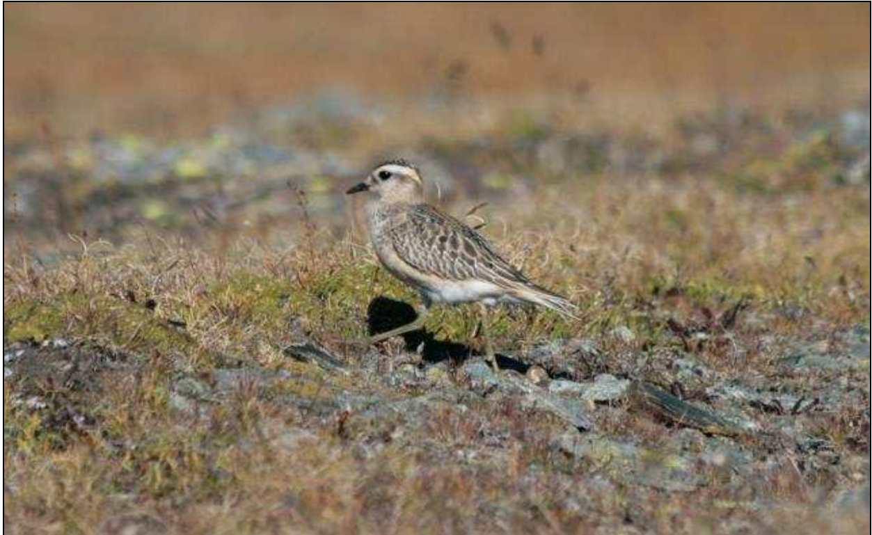
04.09.2010 - Piviere tortolino - Colle del Nivolet