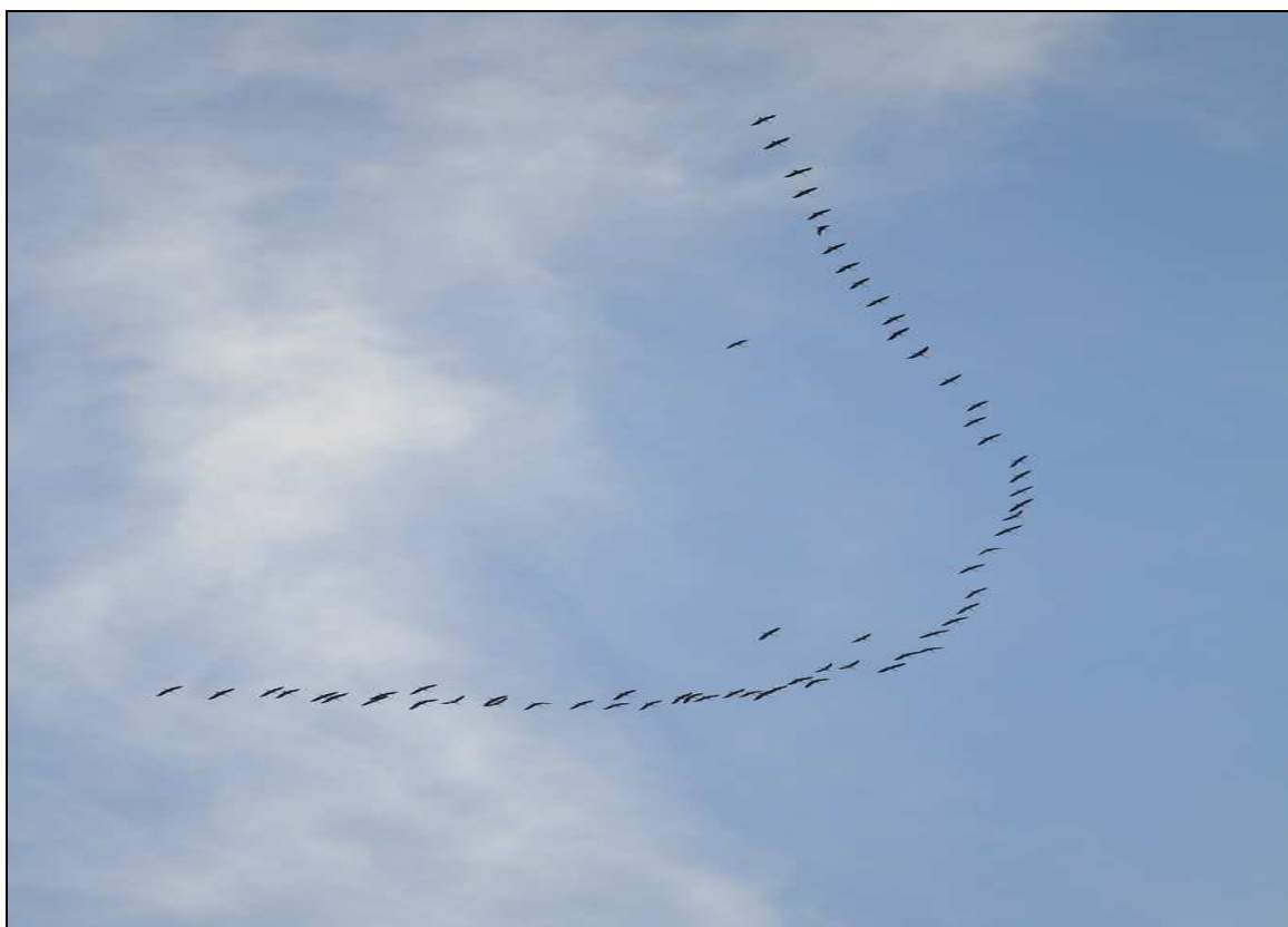
22.11.2010 - Gru - Avigliana

Segnalazioni di piccoli gruppi nel periodo invernale a Brusasco e Foglizzo (OSR, PIL, MAG). Picco del flusso migratorio il 28.10 con 962 ind transitati all'imbocco della Val Susa, 170 a Giaveno,100 a Pinerolo.(Oss.vari). Ancora 287 ind in transito sul lago di San Gillio il 29.10 (ASG) . Il movimento migratorio si è protratto fino alla fine di dicembre: 85 ind il 27.12 a Candia (DDN)