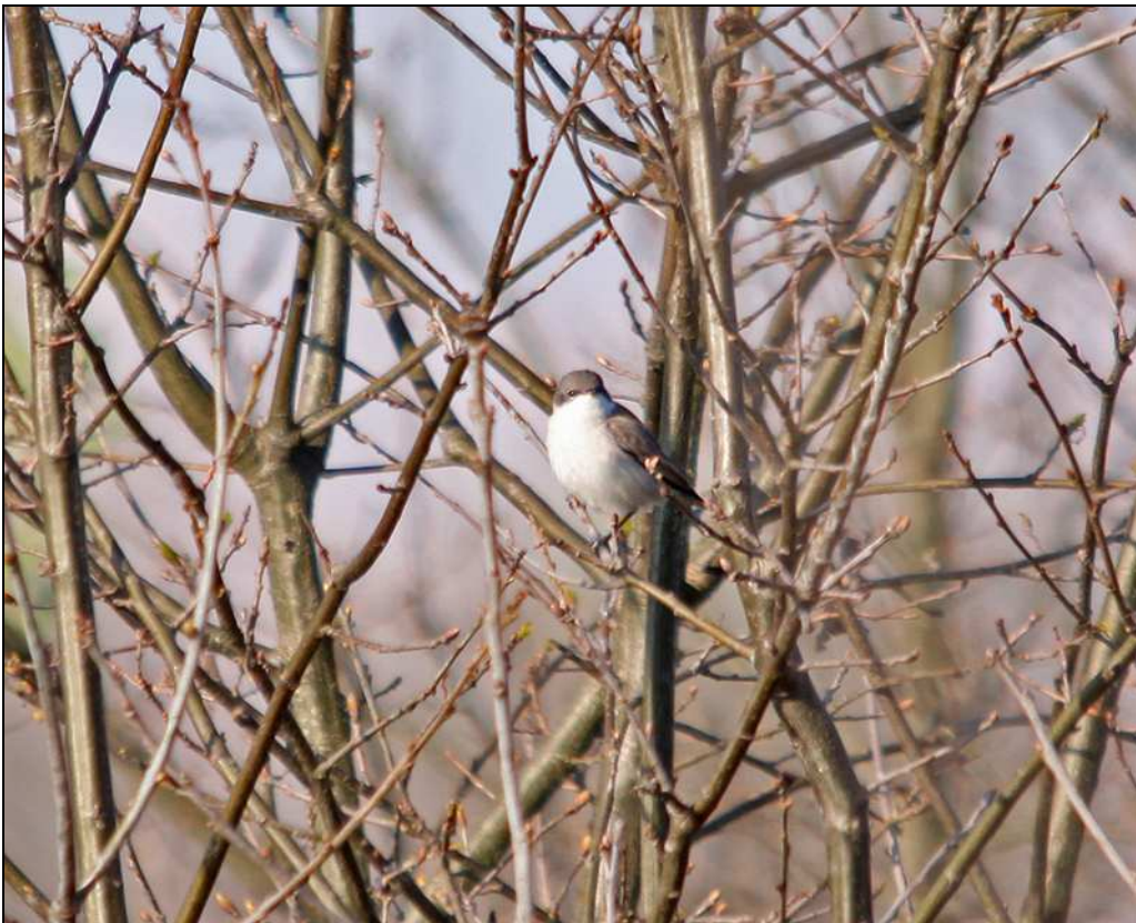
14.04.2010 - Bigiarella – Montanaro

Bigiarella Sylvia curruca B, T Prima segnalazione il 02.04 a Settimo (DRA)