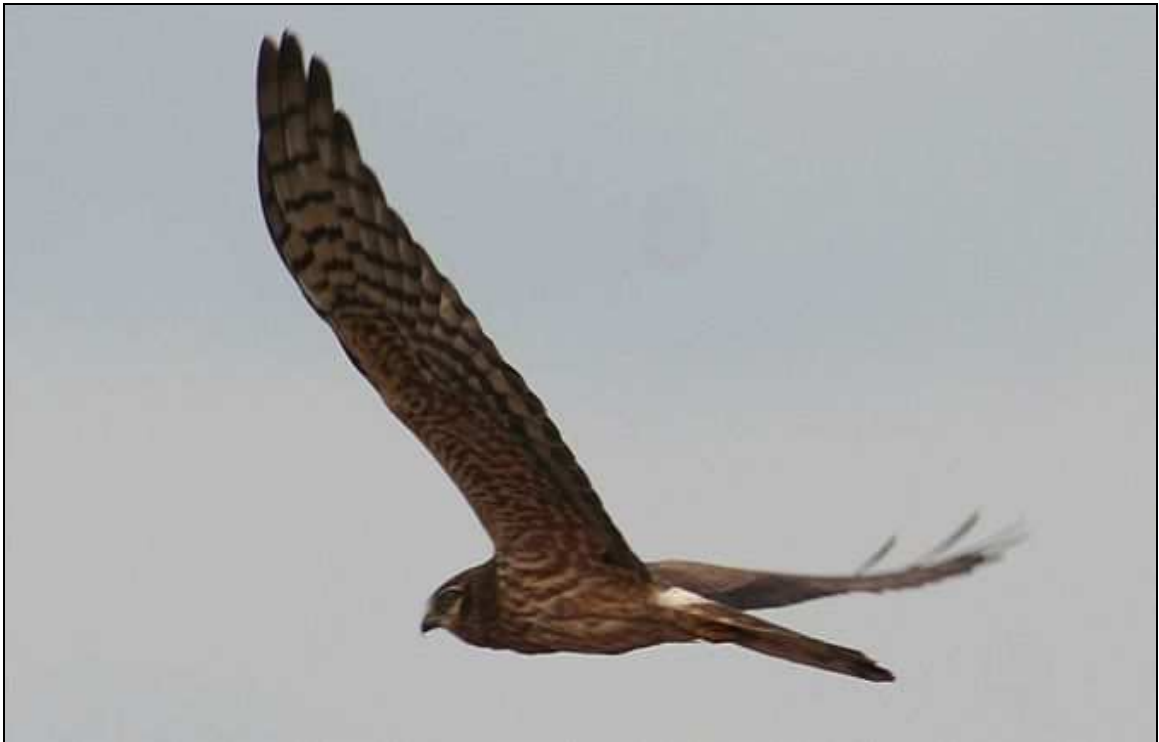
08.05.2010 - Albanella minore – Montanaro