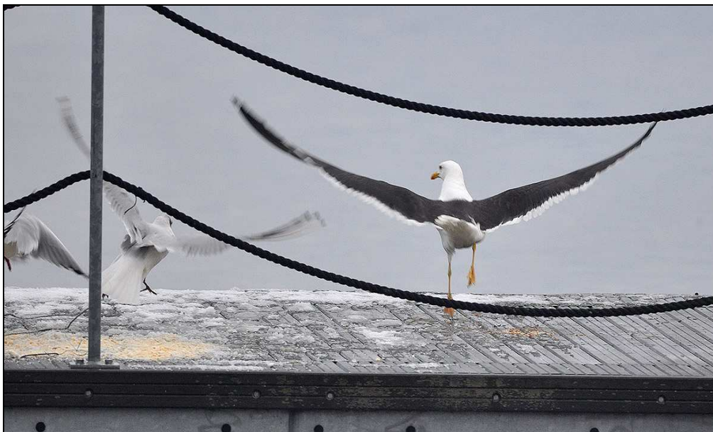
22.12.2010 –Zafferano– Lago di Viverone