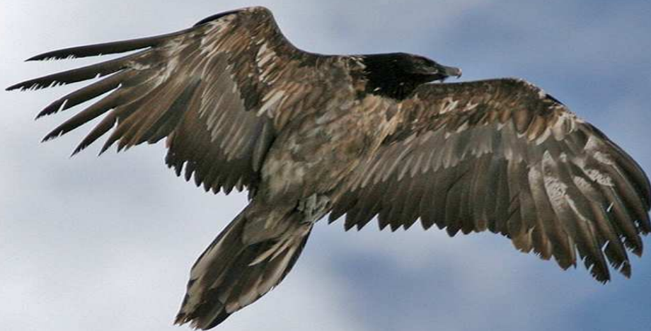
28.09.2010 - Gipeto – Colle dele Finestre