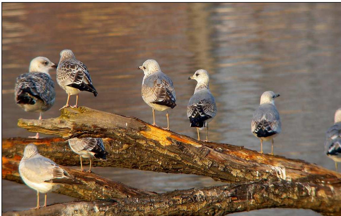
12.02.2010 - Gavine – Diga del Pascolo –Torino

Date estreme : 4 ind il 12.03 (CAD) e 1 ind il 17.10 (DDN) alla diga del Pascolo a Torino. Massima concentrazione 53 ind il 12.02 alla Diga del Pascolo (MAP)