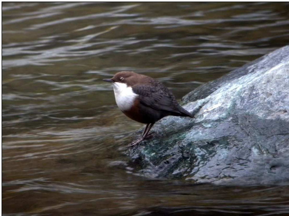
13.11.2010 - Merlo acquaiolo – Lanzo

Recuperato e liberato 1 soggetto rimasto intrappolato in una griglia di aereazione in corso Stati Uniti a Torino il 17.12 (MAC)