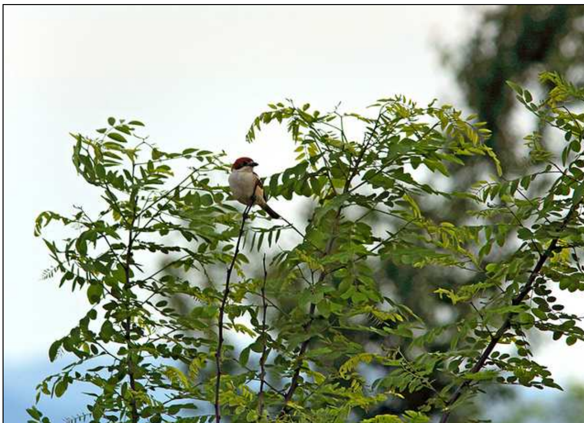
08.05.2010 - Averla capirossa – Montanaro