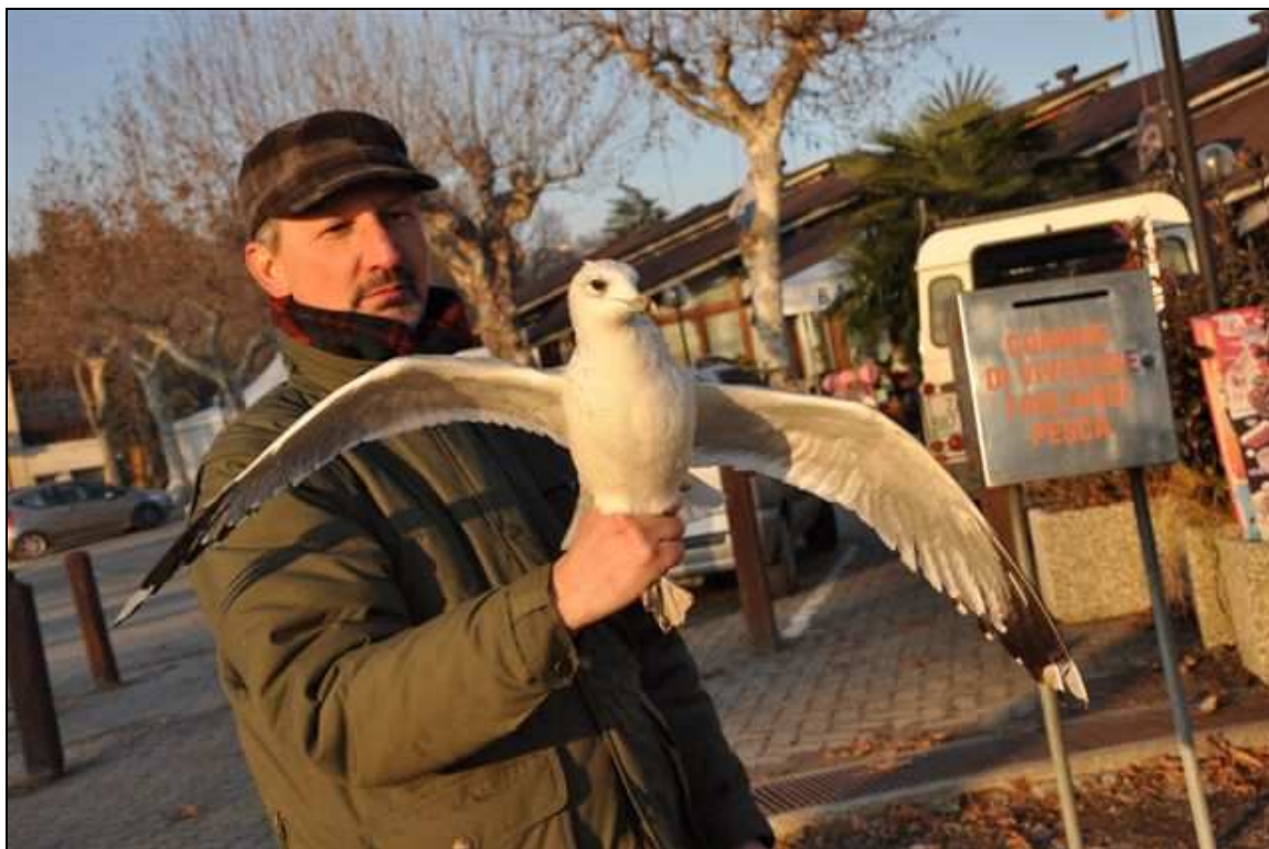
16.12.2010 – Gavina: inanellamento a Viverone