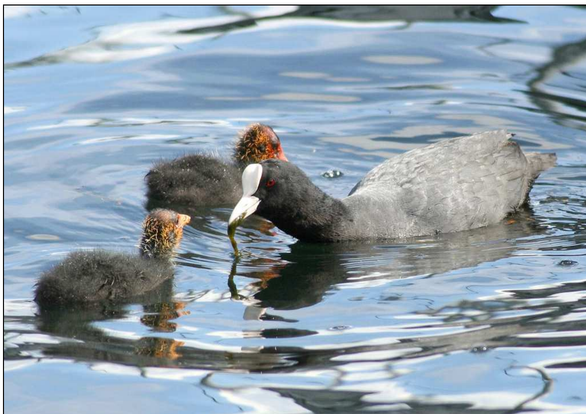
Maggio 2010 -Folaga - Lago di Viverone

Conteggiate durante l'IWC il 10.01 sul lago di Viverone 1492 ind (MAI)