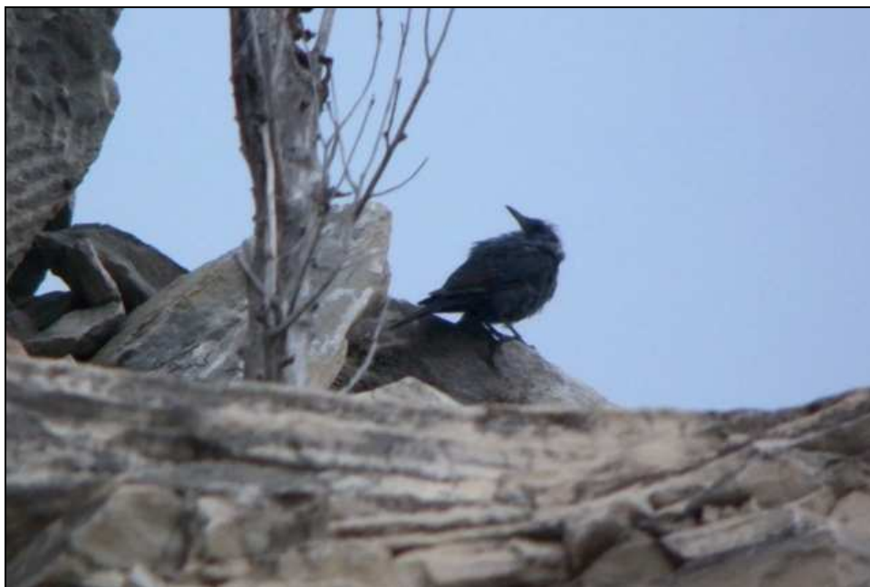
01.08.2010 Passero solitario – Foresto

Passero solitario Monticola solitarius B,W occ 1 ind il 01.08 a Foresto (MAP)