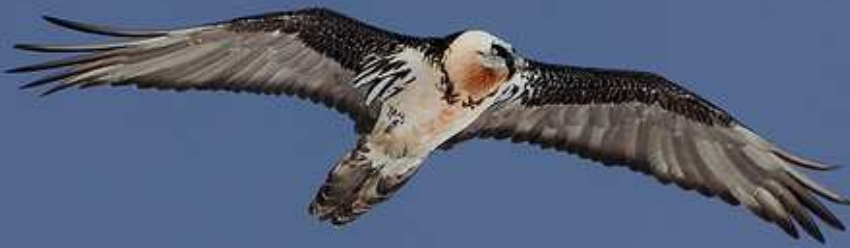
27.02.2010 - Gipeto – Colle del Nivolet